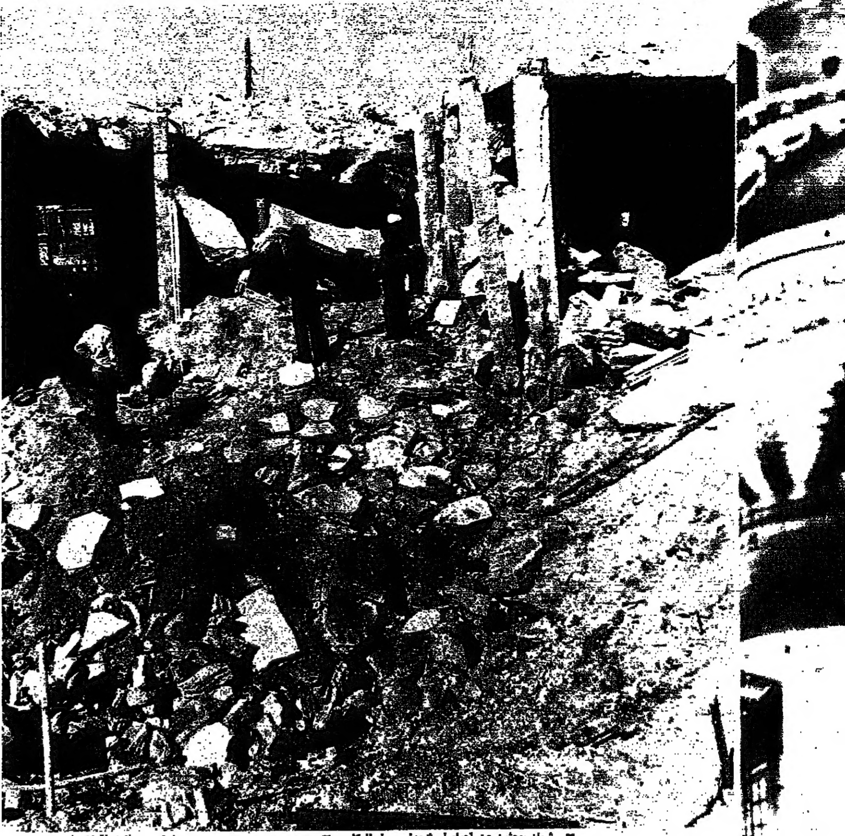
شبان يبحثون عن اجساد او شهادة وسط الركام